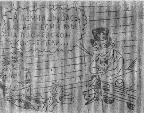
Рис. В. ЖАБСКОГО.