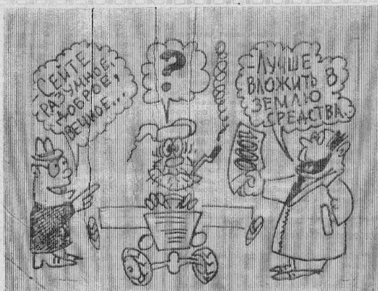
Рис. В. ЖАБСКОГО.