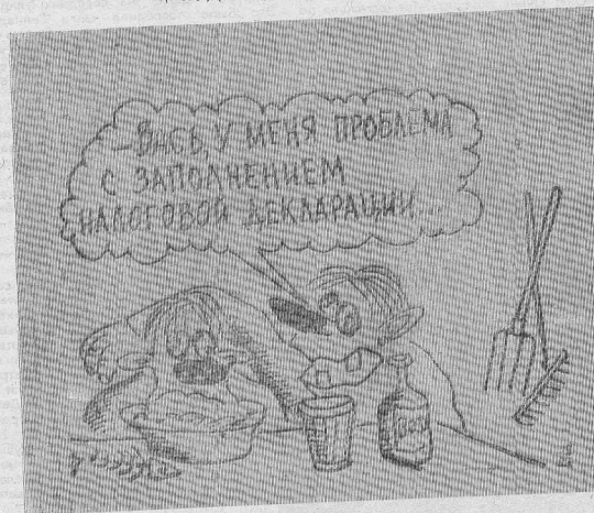
Рис. В. ЖАБСКОГО.