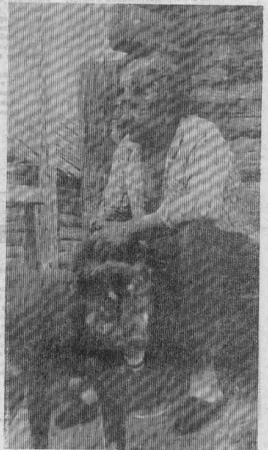
В. РАТУЕВ. Фото автора.