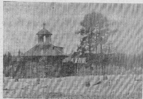
СТАРАЯ ЦЕРКОВЬ В Д. ЖОРХТА.