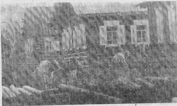
Утро в д. Ярино.

КРЕСТЬЯНСКИЕ ВОПРОСЫ Землю накупили настолько, что там, где прежде в эту пору наливались сочные побег ржи, теперь ростки в верхок высотой начинали желтеть.