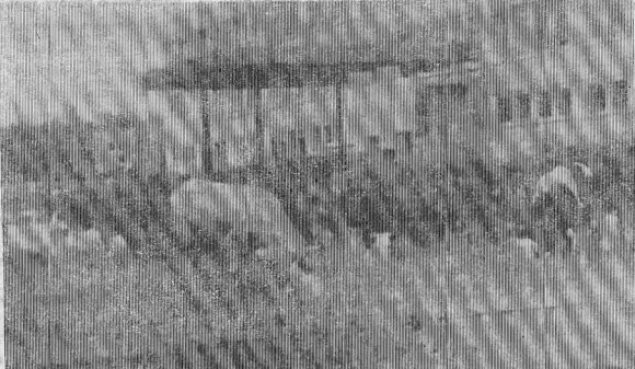
на коровы облюбовали лучший выбор правильного — травы много и... никто не мешает. Н. ЗОНОВА. На снимке: коровы на территории школы № 3.