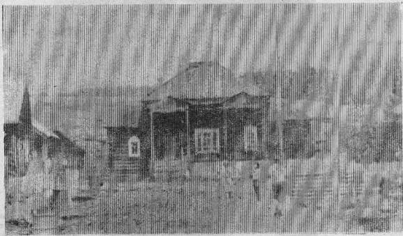
Кудце выглядит церковь без башни, но вековое зда-ние по-прежнему стоит прочно.

чающих и провожающих. Погрузка, разгрузка; радо-стные возгласы встречаю-щих — все говорило о со-бытийности. И неудивитель-но: ведь вертолет из Коди-нска приходит раз в неделю, на канушиках. Я не впервые прилетел в Яркино, но сейчас, как и прежде, меня охватило волне-ное, давнее, от чего дела-ется теплее на душе. Улучи-вается раздражение, и хо-