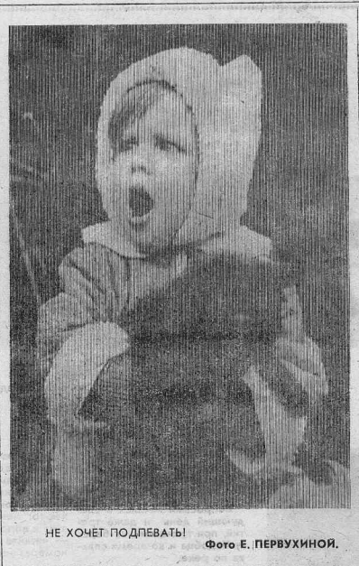
НЕ ХОЧЕТ ПОДПЕВАТЬ!

Обычная соль, как известно, — это хлористый натрий с небольшой примесью минеральных веществ постоянного состава. Анализ и расчеты показывают, что растворимая часть черной соли содержит 94% хлористого натрия и около 6% процентов очень важных веществ, как соединения йода, калия, кальция, меди, цинка и др.