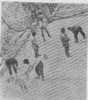
ФОТОРЕПОРТАЖ НАШЕГО КОРРЕСПОНДЕНТА ЕКАТЕРИНЫ ПЕРВУХИНОЙ С ПЛОТИНЫ БОГУЧАНСКОЙ ГЭС.