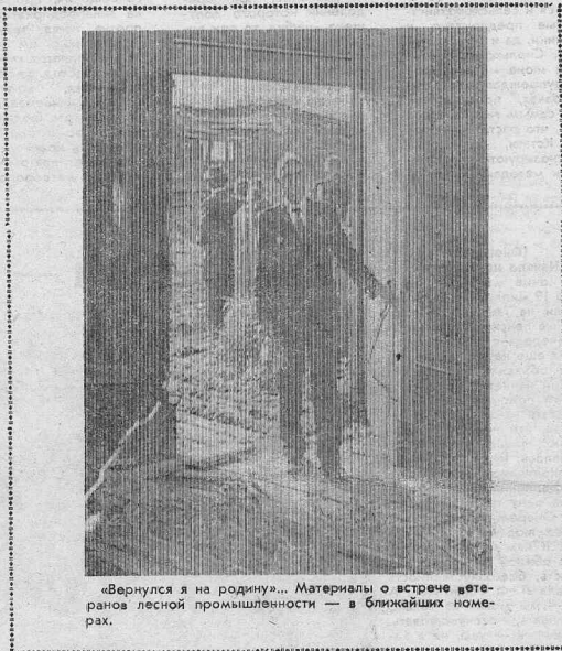
«Вернулся я на родину...» Материалы о встрече ветеранов лесной промышленности — в ближайших номерах.