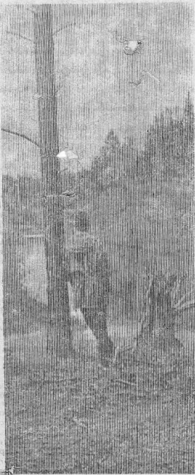
Мура — спокойная, неширокая, петляющая в окрестностях, заливаемые паводковыми водами, невысокие холмы, покрытые лесами. Гармоничны, покои, удивительная красота наполняют душу восторгом... Хочется смотреть и смотреть на панораму Муры — великолепное творение природы.

Ну а сама деревня? Резкий контраст с природой. Грязная, неухоженная, заваленная дровами. Поломанные заборы, помойки, кучи мусора, множество свиней, спокойно гуляющих по улицам.