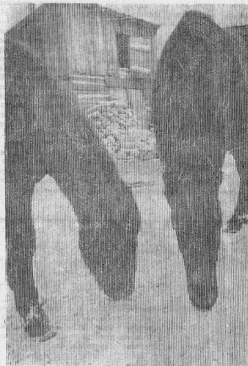
АХ ВЫ КОНИ МОИ, КОНИ...

Действие фильма происходит на дне океана. Четверо террористов крадут ядерные ракеты с ближайшей военно-морской базы. Во время транспортировки с одной из ракет падает табличка, предупреждающая об опасности. Не обойдите вниманием этот фильм!