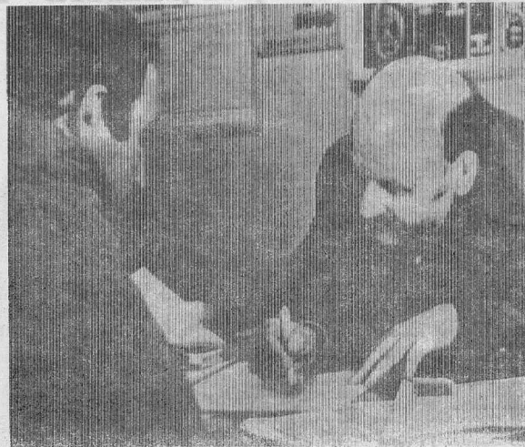
«УЗЕЛОК НА ПАМЯТЬ».