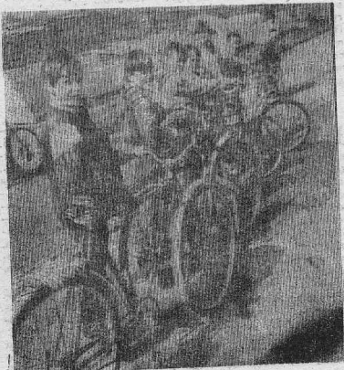
СПОРТСМЕНЫ И БОЛЕЛЬЩИКИ.

Зеркала и оконные стекла хорошо очищаются, если мыть их соленой водой.