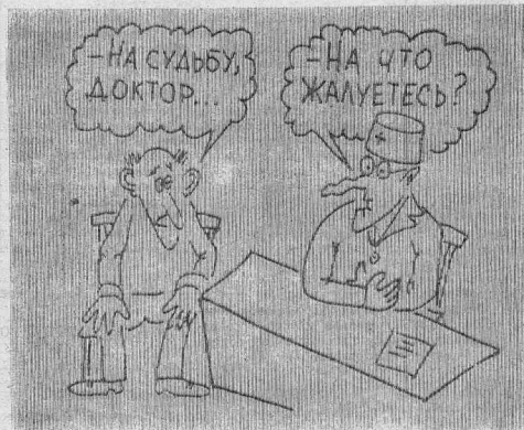
Рис. В. ЖАБСКОГО.