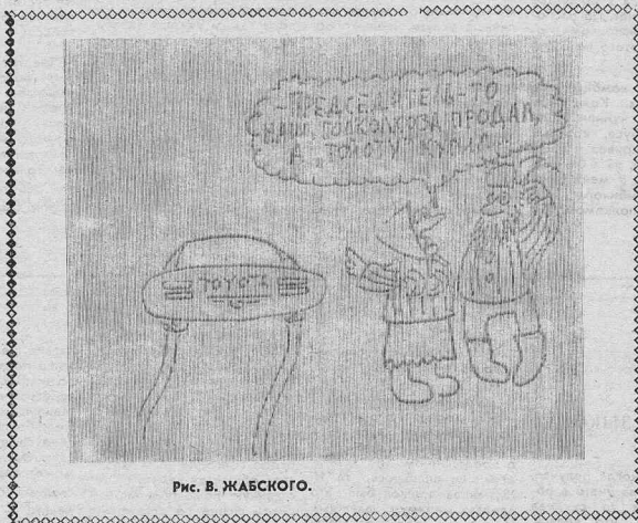
Рис. В. ЖАБСКОГО.

Постскриптум. Гонорар прошу пере- числить на счет строительства церкви.