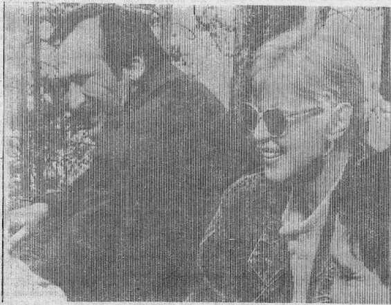
На снимке: Леонид Филатов и его жена — актриса Нина Щацкая.

текст, смешно и удачно имитировал голоса. Оказалось, кстати, что он — автор не только веселых сатирических стихов и знаменитой сказки, но в его творчестве есть и серьезные стихи. Мы услышали стихотворения «Юхельбеккер» и «Ответ анонимичкам».