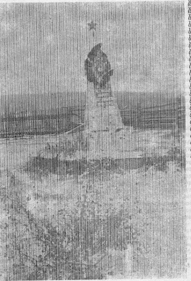
Надпись на памятнике:

«НИКОГДА НЕ ЗАБЫТЬ, НИЧЕГО НЕ ЗАБЫТО...»