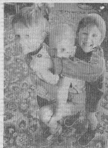
Снимок сделан фоторепером В. Ратуевым в саду п. Тажный.