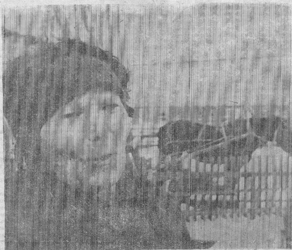
Вот и закончилось наше путешествие по деревням верхней части района. Сегодня мы познакомились с нашими впечатлениями от пребывания в Усольцево и Фролово (2 прилож.).

После установленного срока баланс будет приниматься с начислением штрафных санкций.