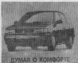
ДУМАЮ О КОМФОРТЕ

За справками обращаться в отдел кадров ПЭТСК по телефону 2-13-44.