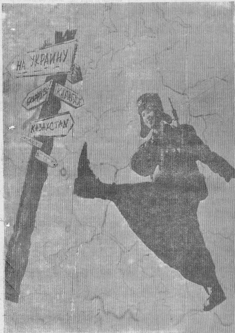
КУДА ТЕПЕРЬ ИДИ СОЛДАТУ И ГДЕ СЛУЖИТЬ СЕРЧАС ЕМУ?..