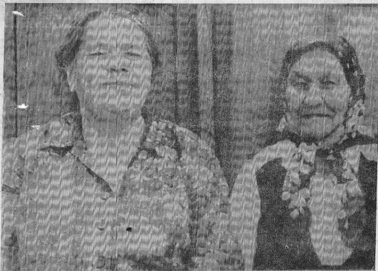
«Бабушки, бабушки, бабушки — старушки...»