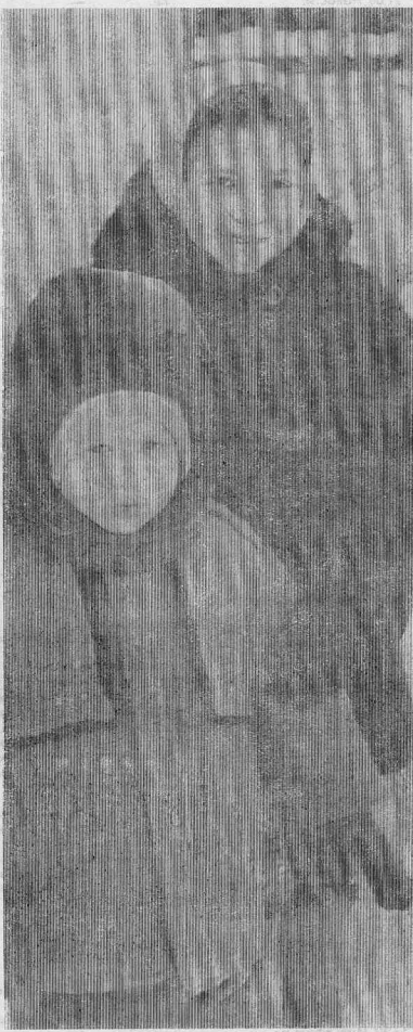
Родители школьников составили график ночных дежурств, чтобы избежать поджога школы. В поселок бандиты наезжали. Как, например, в августе, когда отменился день поселка, ввдур подъехала машина,

Благополучие нашей страны, которое просто выпирало активной пропагандой, оказалось нарывом, лопнувшим сейчас. И помню. А мы терзали себя жизненными ценностями и думали и так: пусть дорого, пусть холодно, но пусть не будет войны... Той, гражданской войны, что шумит в разных уголках нашего содружества. И матери, как во все времена, спасают своих детей. Об этом наша сегодняшняя подборка.