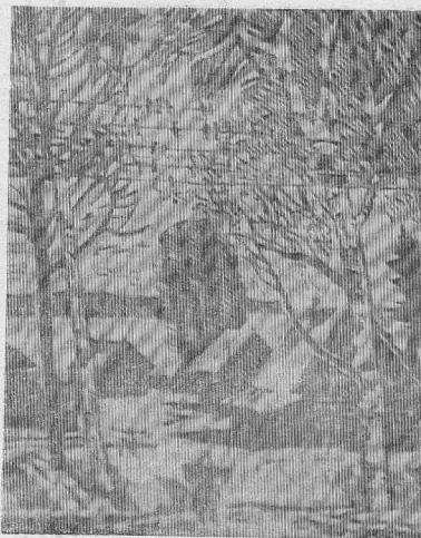
РЕЗЬБА ПО ДЕРЕВУ