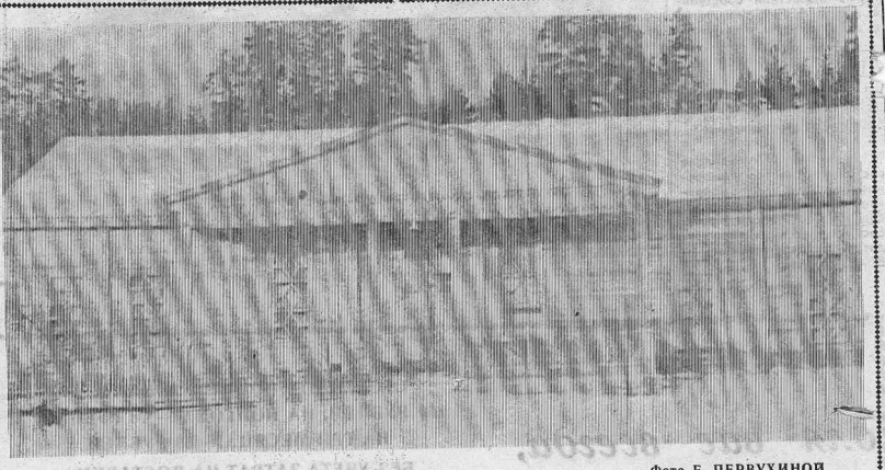
Дом культуры в п. Тагара.