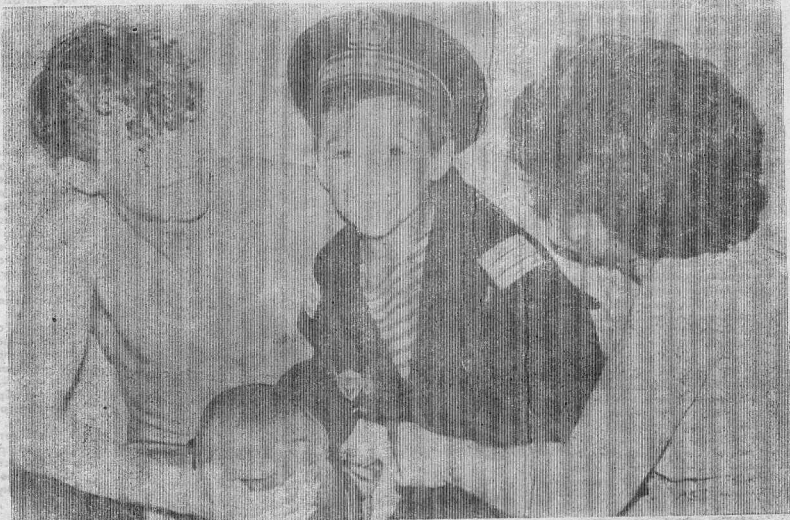
Стану капитаном. Буду знаменит.

Еще не так давно мы страховали своих детей к совершеннолетию, сейчас, в связи с инфляцией, это потеряло смысл. И потому «Бизнес» предлагает (за 14 клиентов) преобразовать эту страховку в накопительное страхование.