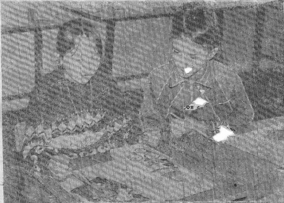
На занятиях кружка «Художественная роспись по дереву» в средней школе № 4 г. Кодкинска.

В течение 1992 года, по инициативе администрации различных уровней, стали создаваться отделы, либо комитеты, по делам молодежи. Так, в нашем крае почти в половине районов созданы подобные отделы. Существует такой отдел и у нас. Основная работа, которой приходится заниматься мне, как его руководителю, сводится к работе районной комиссии по делам несовершеннолетних. Эта деятельность необходима, но хотелось бы уделить внимание не только тем, кто совершил какое-либо правонарушение. Ситуация в крае примерно такая же, как и у нас в районе. Почти все отделы по работе с молодежью занимаются либо комиссиями по делам несовершеннолетних, либо каким-нибудь клубом по интересам, либо детскими приютами. Но что самое интересное: правового отдела или комитета молодежи не существует (в одно время он был создан и работал). По-видимому, руководство края считает, что с молодежью в регионе все в порядке. А вот в Омске, только в областном комитете молодежи, работает 6 человек, им на 1992 год выделено администрацией области 6 миллионов рублей на осуществление молодежной политики.