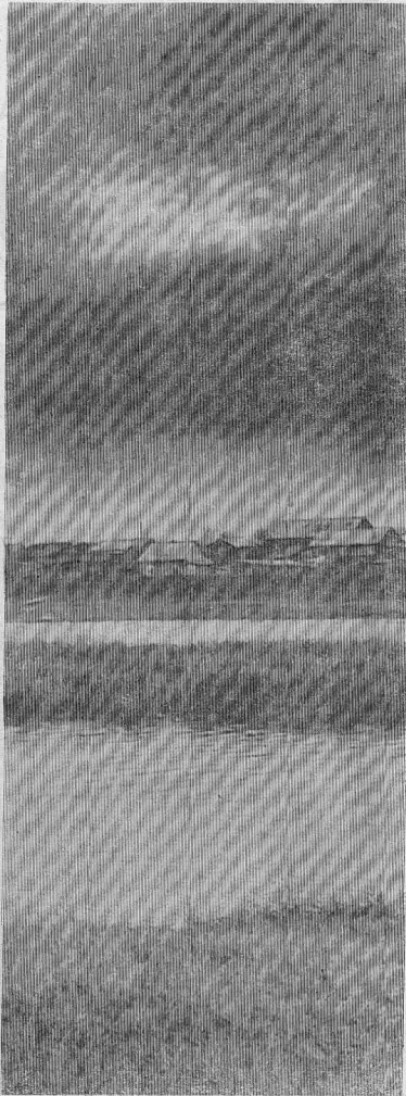
НА ЗАКАТЕ ДНЯ.