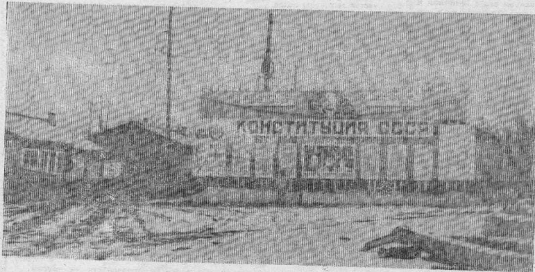
Монументально и красочно выполнена на площади в Ново-Болтурино наглядная агитация, но... она вчерашнего дня.