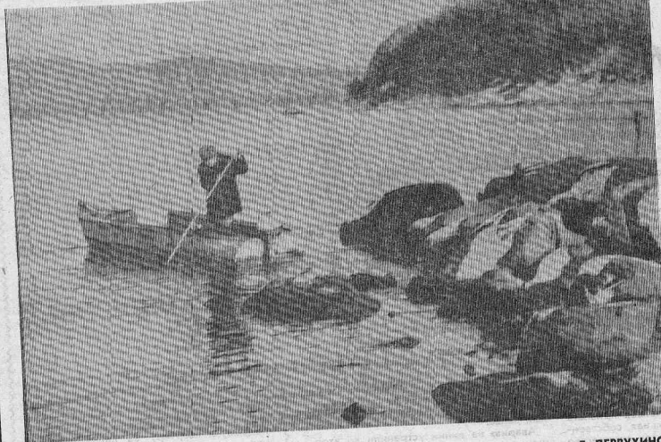
ОКТАБРЬСКИМ ДНЕМ НА РЕКЕ.