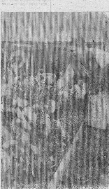
«ОТПВЕЛИ УЖ ДАВНО...»