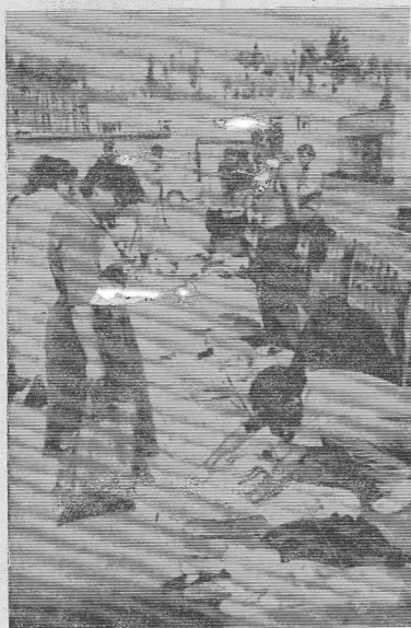
Фоторисназ В. РАТУЕВА.