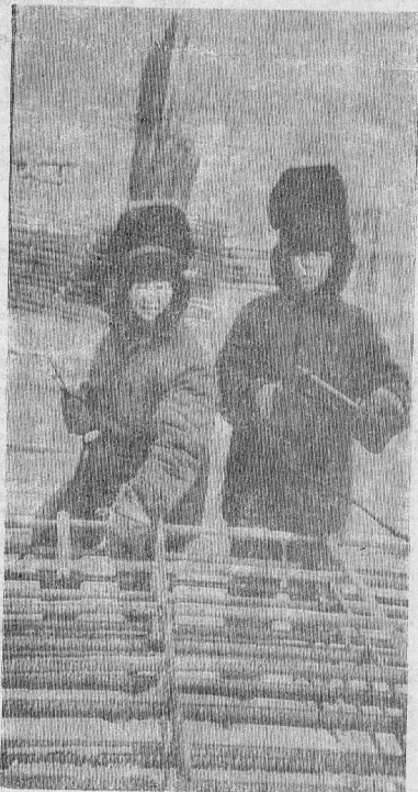
Казалось бы, электросварщик — профессия не женская, — у всех богов во власти...

— А где те мужики? В кооперативах да в кабинетах рубли считают. А ну, подруга, покажем им, как надо зарабатывать.