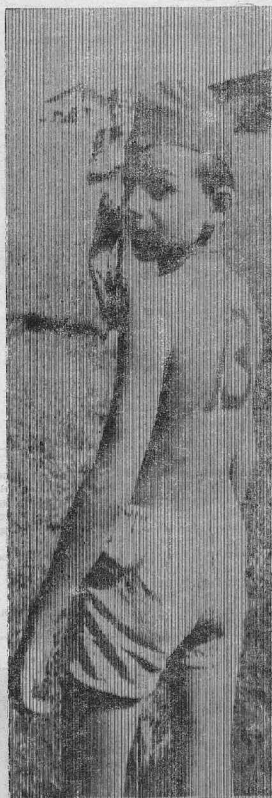
ДЕФИЦИТ — СПОРТУ НЕ ПОМЕХА.