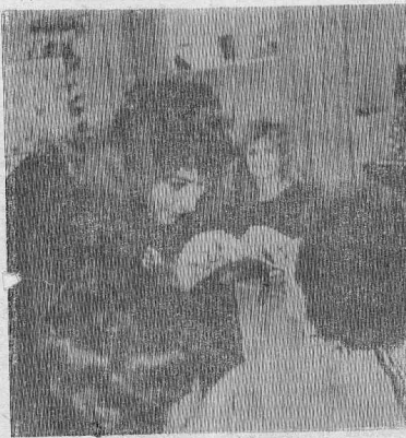
Показ практических навыков — обязательная составная часть профессионального конкурса медицинских работников.