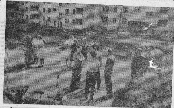
Вот все (на снимке) или почти все, кого у да л о сь собрать авторам авантюрного плана плату, в ущерб основной работе, личному и отпускному времени, будущим жильцам предложено заняться отделкой всех квартир. Известно, что большинство новоселов первых трех этажей

емых подъездов составляют жители других сел, ветераны, которые, естественно, не смогут принять участие в предстоящей работе. Поэтому десятку собравшихся и было предложено красить и клеить обои не только в своих квартирах... то есть поработать на дядю, за счет своих сбережений.