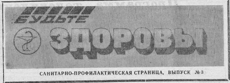
САНИТАРНО-ПРОФИЛАКТИЧЕСКАЯ СТРАНИЦА, ВЫПУСК № 3

Народная калмыцкая медицина утверждает: это совсем несложно, а процент надежности прогноза настолько убедительный, что достаточно... точно высчитать возраст родителей ко дню начала беременности — в годах, месяцах и днях. И именно ко дню начала беременности (протестировать несколько потерей точности, если возраст родителей определять к месяцу ее начала). Затем возраст отца делится на четыре, а матери на три. Полученные десятичные дроби остается сравнить: пол вашего будущего ребенка совпадет с полом того родителя, чья дробь окажется больше.