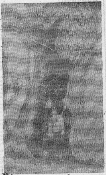
ЧЕМ НЕ ЛЕСНАЯ СКАЗКА — ДУПЛО, В КОТОРОМ МОЖЕТ УКРЫТЬСЯ ОТ ДОЖДЯ... ЦЕЛАЯ СЕМЬЯ! ВОЗМОЖНО, У НАШИХ ФОТОЛЮБИТЕЛЕЙ ТОЖЕ НАЙДУТСЯ ПОДОБНЫЕ СНИМКИ! ТОГДА МОЖНО БЫЛО БЫ ОБЪЯВИТЬ ФОТОКОНКУРС «ПРИРОДА И МЫ».