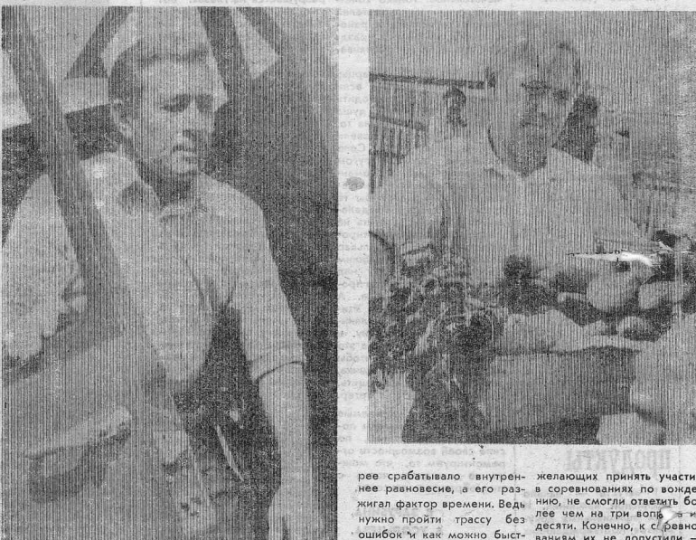
Элементы соревнований. Самыми трудными были известные каждому водителю: ворота, бокс, стюкалка, пенки и ломали. Но это все колее и пенки, обехать которые удалось немногим.

желаящих принять участие в соревнованиях по вождению, не смогли ответить более чем на три воля в десяти. Конечно, к судьям они не допустили — судьи работали беспристрастно. Что же, праздник — праздником, а водитель должен быть предельно внимателен, даже на отдыхе.