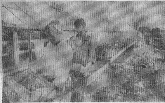
Вареники, «маг», модная цепочка, мотоцикл и компьютер — великий круг забот наших детей-школьников. И все это требует расходов, и не малых. Порой тощие кошельки родителей заставляют их, сверстников, с завистью смотреть друг на друга. Но в последнее время все больше встречается молодых людей — ребят и девочек, — работающих на производстве. Они уже сейчас с 10—15 лет сами беспокоятся о своем достатке.