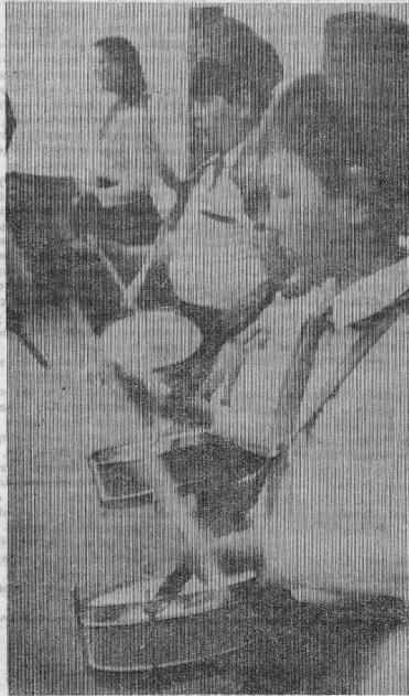
На днях ряды пионерии района значительно пополнились. На снимке: во время приема в пионеры на торжественной линейке в школе № 3 г. Кюдинска.