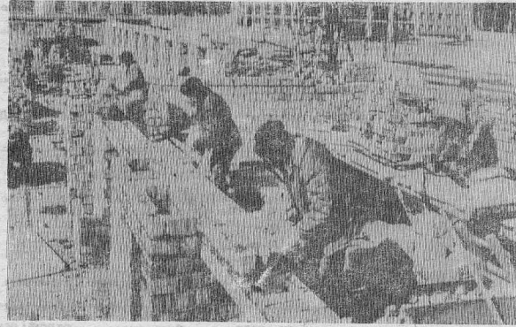
Кирпичная кладка на строительстве роддома ведется силами бригады наемщиков УСГК (управления строитель-