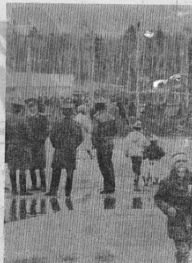
нового, протест или необходимость? Свобода мыслей, свобода действий — не к этому ли стремились?