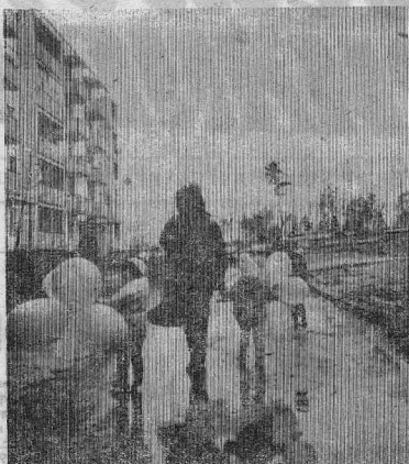
Были флаги и шары, наряды милиции и народные ма- ссы (правда, у магазинов). Но не было традиционного шествия, не было единства, а так хотелось... А люди ждали, надеялись, искали и находили... каждый свое, отдельно выдуманное. Что это? Развал устоев или поиск