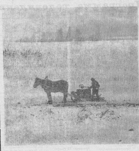
Однажды, в студеную зимнюю пору...