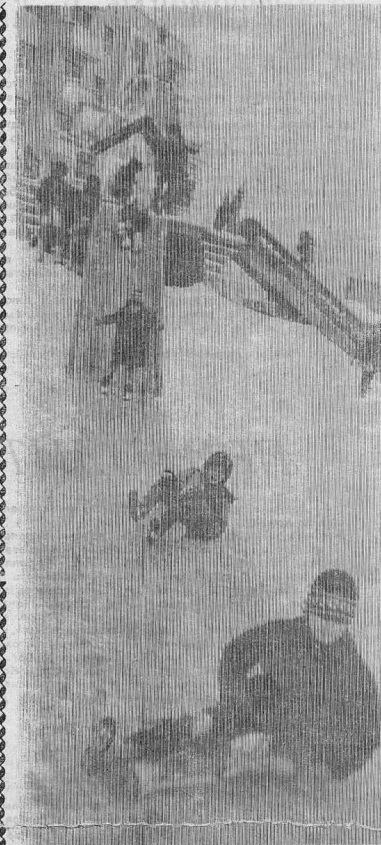
Глядя на эту фотографию, позавидовала я мальчишкам и девчонкам: как лихо катят они с высокой горки: кто на картонке, кто на своих двоих.

Материал собран директором Кежемского историко-революционного музея Н. БРЮХАНОВОЙ.