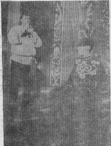
КАК ПРИЯТНО ПОСЛЕ УТОМИТЕЛЬНОГО РАБОЧЕГО ДНЯ ВСТРЕТИТЬСЯ ВМЕСТЕ, ПОПЬТЬ, ПОТАНЦЕВАТЬ, ПОМУЗИЦИРОВАТЬ. НЕЧАСТЫ СЛУЧАИ. ТЕПЕРЬ ТАКИЕ ВСТРЕЧИ, ВСЕ МЕНЬШЕ И МЕНЬШЕ ЛЮДИ УЖЕ НЕ ДРУГ К ДРУГУ. НО В ПОС. ПРОСЯХИНО НЕ ЗАБЫВАЮТ СТАРЫЕ ТРАДИЦИИ. НА СНИМКЕ: ФРАГМЕНТ ВЫСТУПЛЕНИЯ САМОДЕЯТЕЛЬНЫХ МУЗЫКАНТОВ.