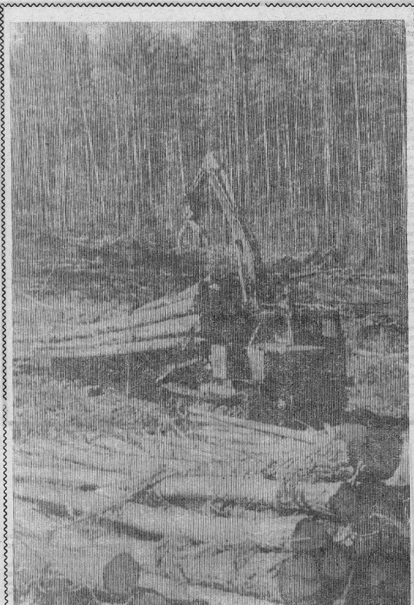
НА ПОГРУЗОЧНОЙ ПЛОЩАДКЕ ЛП-18

Пришел он после работы на участок и остолебен: два незнакомых, задорных «камбала» собирают выращенный его семьей урожай. Да еще на него покрикивают: чего мол, мужик, смотришь! Заспаяйся, пока хозяйка нет. Слышь, хозяин, ликвидацию совершал, как быт. Признавайся, кто ты, — можно и инвалидом остаться: вид у незваных «помощников» грозный. А вот если принять их предложение, хоть что-то от урожая и самому доставать... Так и сделал. Вскоре воры удалились, восвояси, каждый с мешком отборных клубней за плечами. А вслед за ними понес домой оставшуюся картошку и сам хозяин.