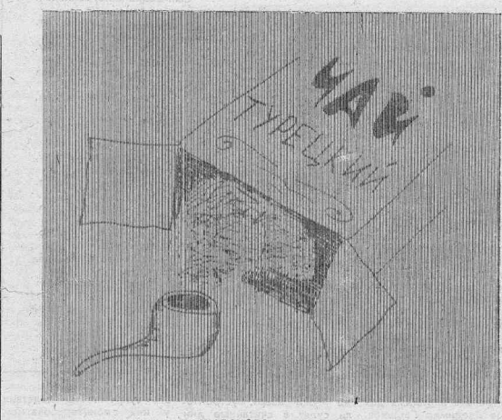
Карикатура В. ЖАБСКОГО

Учредители: РАЙОННЫЙ СВЕТ НАРОДНЫХ ДЕПУТАТОВ И ТРУДОВОЙ КОЛЛЕКТИВ РЕДАКЦИИ РЕДАКТОР Л. И. КЛИМОВИЧ НАШ АДРЕС: 663470, г. Кожинск, Красноярского края, телефоны 2-28-99, 2-41-31. Газета выходит по вторникам, четвергам и субботам. ОТДЕЛЫ РЕДАКЦИИ: общественно-политический, социально-экономический, информации и фотомиллюстрации, писем. Индекс 52336. Печать высокая. Объем 1 пек. Тираж 5 807. Заказ № 0584. Кежемская типография управления печати, массовой информации и книжной торговли крайисполкома. Ответственный Л. Ратуева. Корректор Н. Полкова. Метрантаж О. Карнаузова. Литоист А. Кригер. Печатник Н. Быков.