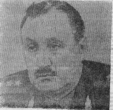
МАКАШОВ Альберт Михайлович

Родился в 1946 году в городе Алма-Ате. Русский. Окончил Институт стран Азии и Африки при МГУ и юридический факультет МГУ. Работал в различных общественных, государственных и кооперативных организациях. В декабре 1989 года принял участие в очередном съезде Либерально-демократической партии. С марта 1990 года — Председатель этой партии. Лейтмотив предвыборной кампании Владимира Жириновского — «Я буду защищать русских и малые народы на всей территории России и СССР».