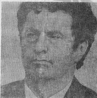
ЖИРИНОВСКИЙ Владимир Вольфович

Родился в 1946 году в городе Алма-Ате. Русский. Окончил Институт стран Азии и Африки при МГУ и юридический факультет МГУ. Работал в различных общественных, государственных и кооперативных организациях. В декабре 1989 года принял участие в очередном съезде Либерально-демократической партии. С марта 1990 года — Председатель этой партии. Лейтмотив предвыборной кампании Владимира Жириновского — «Я буду защищать русских и малые народы на всей территории России и СССР».