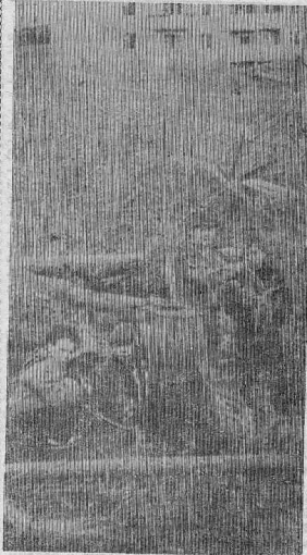
«ВОРОТА» В СВЕТЛОЕ БУДУЩЕЕ.