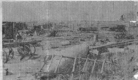
К сожалению, наше полиграфическое оборудование не может дать четкого изображения этого снимка. Поэтому поясню: здесь запечатлены два клубнички в деревне Чудовье. Один на первом плане — из металлических останков