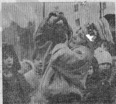
Зима сопротивлялась. Но, несмотря на ее капризы, праздник состоялся. Был и столб с призами для ловких и упрямых (правда, призы находились внизу, а не на вершине — ветер мешал), и пылающее чучело — словом, все как по традиции и даже лучше. Районный и городской Совет, учреждение К-100, ОПК треста выделили для этого мероприятия крупные суммы. Разигрывалась потеря с дефицитными товарами.