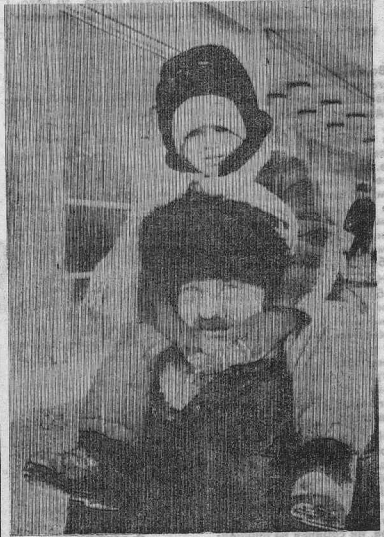
Из цикла «Дядя, сфотогай «СТУПЕНИ РОСТА», «СУСАНИ»».