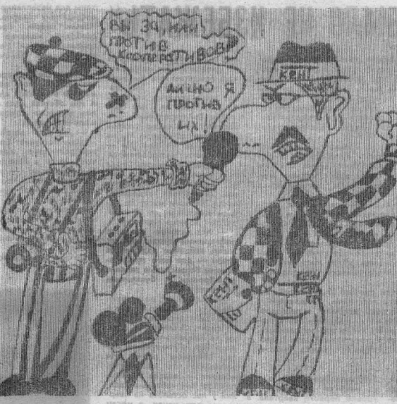
Рисунок ученика школы № 2 г. Кудинска Славы Рогожинкова.