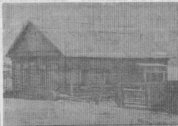
На верхнем снимке: Без больных и без... А в этом «клубе», У реки, Гуляют только... «Медпункт» — без окон, врачей, Сквозняки, без дверей, На нижнем снимке: