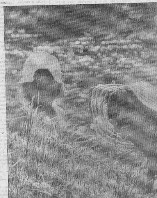
«ЛЕТО, АХ ЛЕТО... ЛЕТО ЗВОНКОЕ, БУДЬ СО МНОЙ!»

Солнечный дождь, дождь золотой, Люди его называют дождем грибовой. Брызжет алмазами тонкая нить, Острая, скользкая — не хватить. Гордой царницей, спускаясь с небес, Радуга шлейфом задела за лес И, засверкав семиметровой дугой, Солнце дразнила своей красотой. Лес очарованный, молча стоял, Царскую мантию короной держал. Г. Зеленина. г. Кодинск.